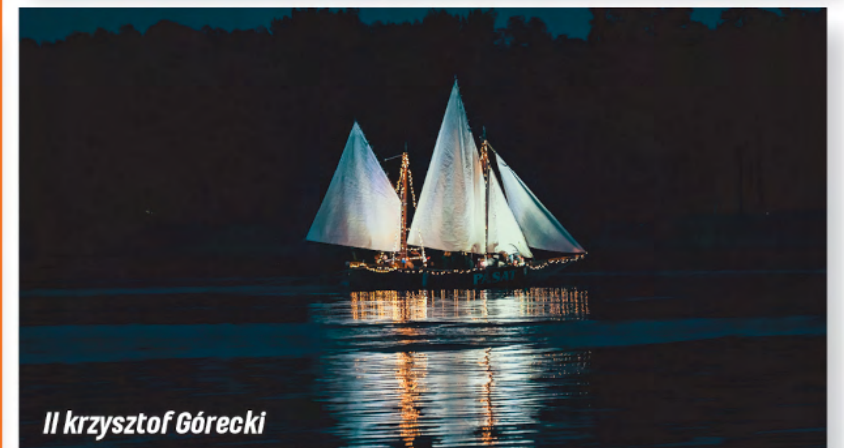
II Krzysztof Górecki