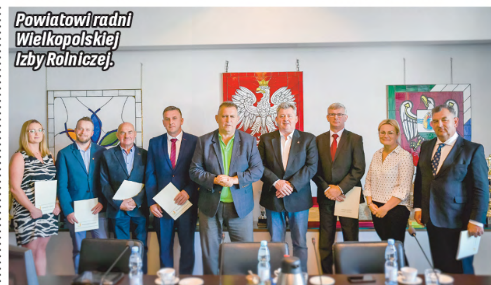
Powiatowi radni Wielkopolskiej Izby Rolniczej.