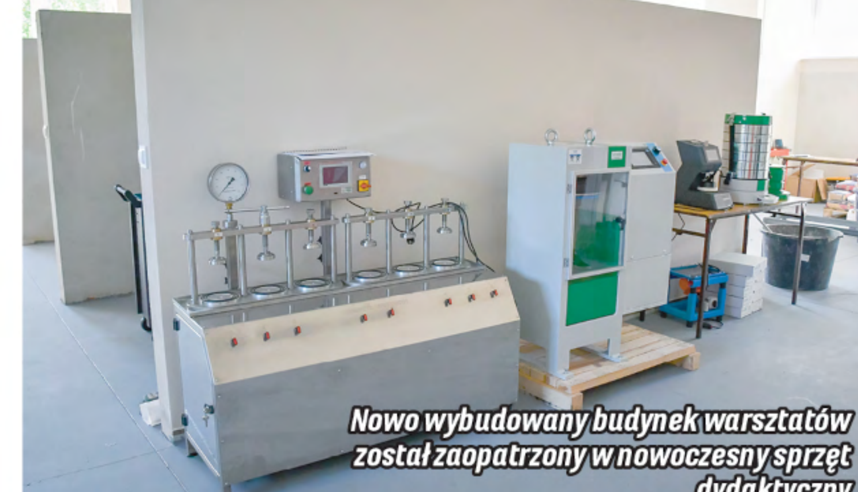
Nowo wybudowany budynek warsztatów został zaopatrzony w nowoczesny sprzęt dydaktyczny