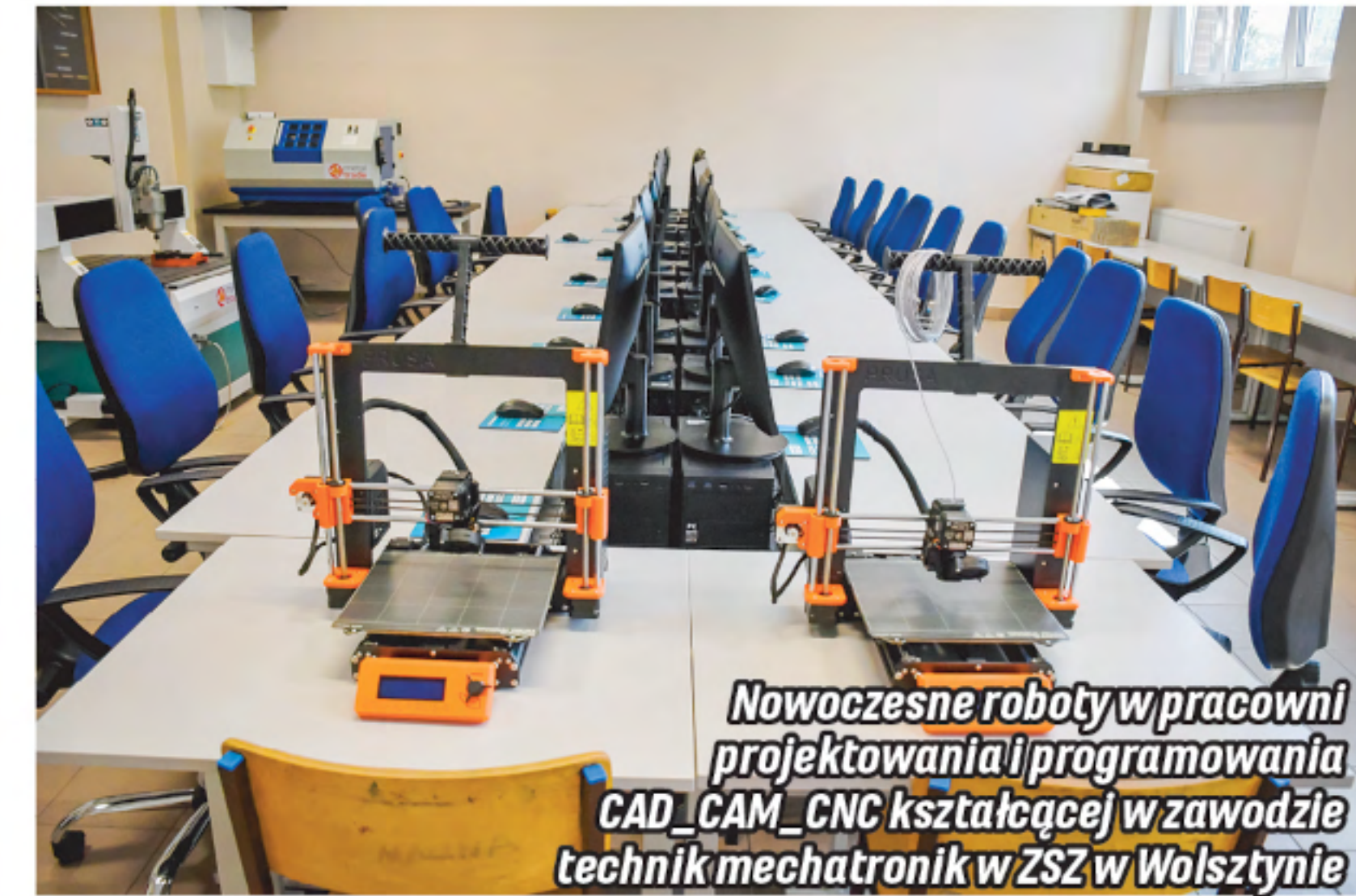
Nowoczesne roboty w pracowni projektowania i programowania CAD-CAM-CNC kształcącej w zawodzie technik mechatronik w ZSZ w Wolsztynie