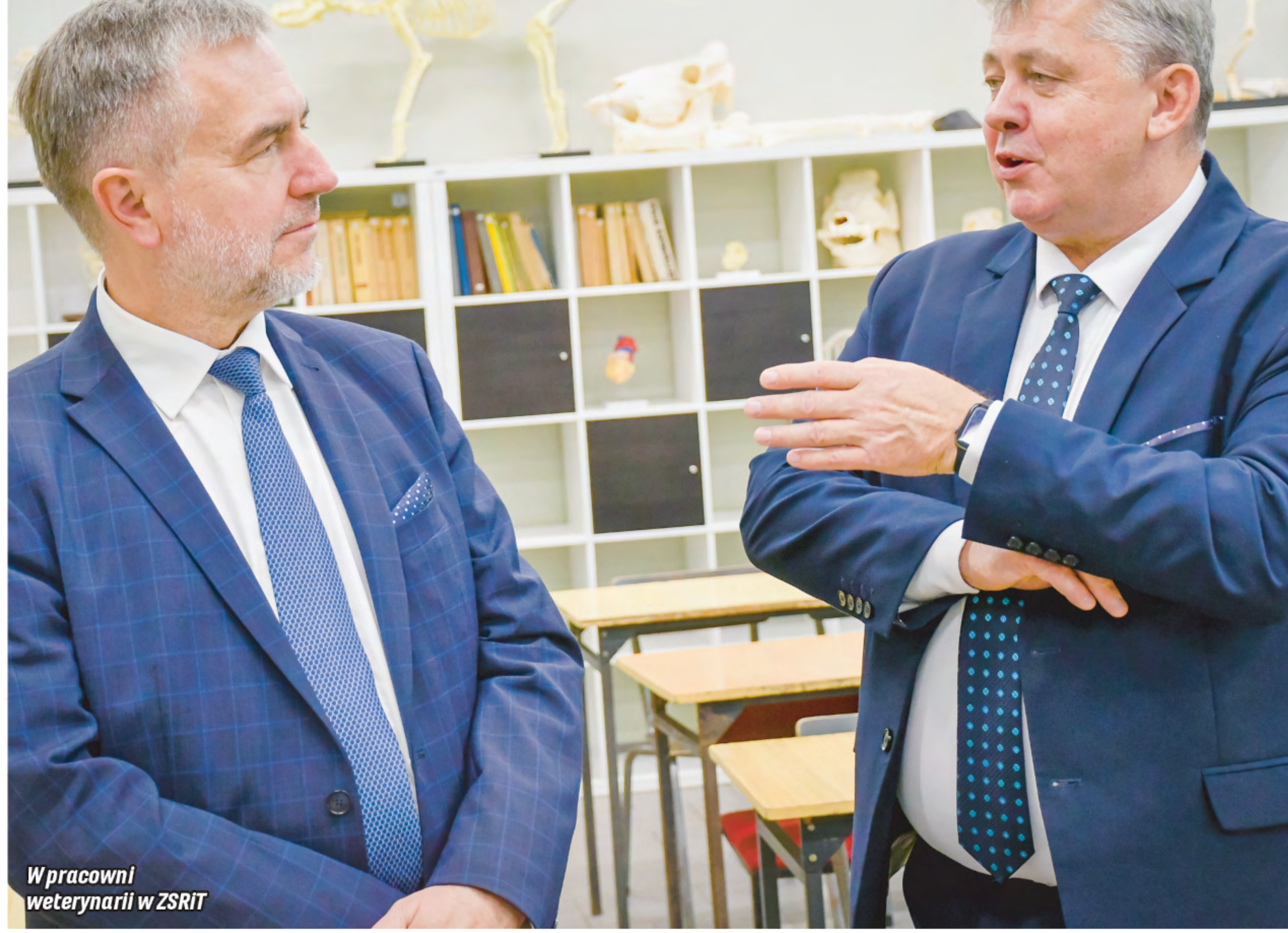
W pracowni weterynarii w ZSRiT

- Cieszę się, że jedno z wyższych dofinansowań na szkolnictwo zawodowe trafiło do naszych szkół,