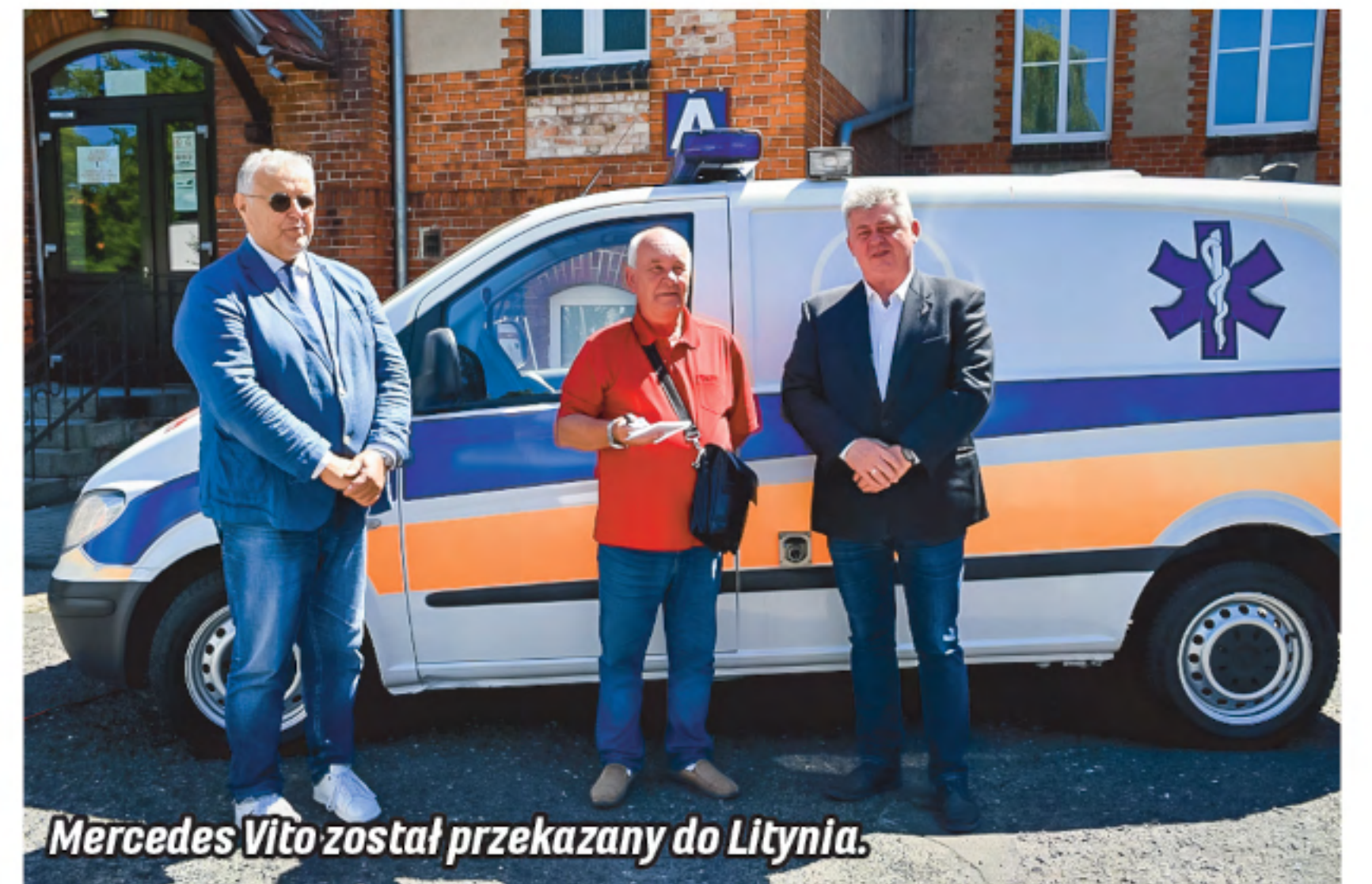
Mercedes Vito został przekazany do Litynia.