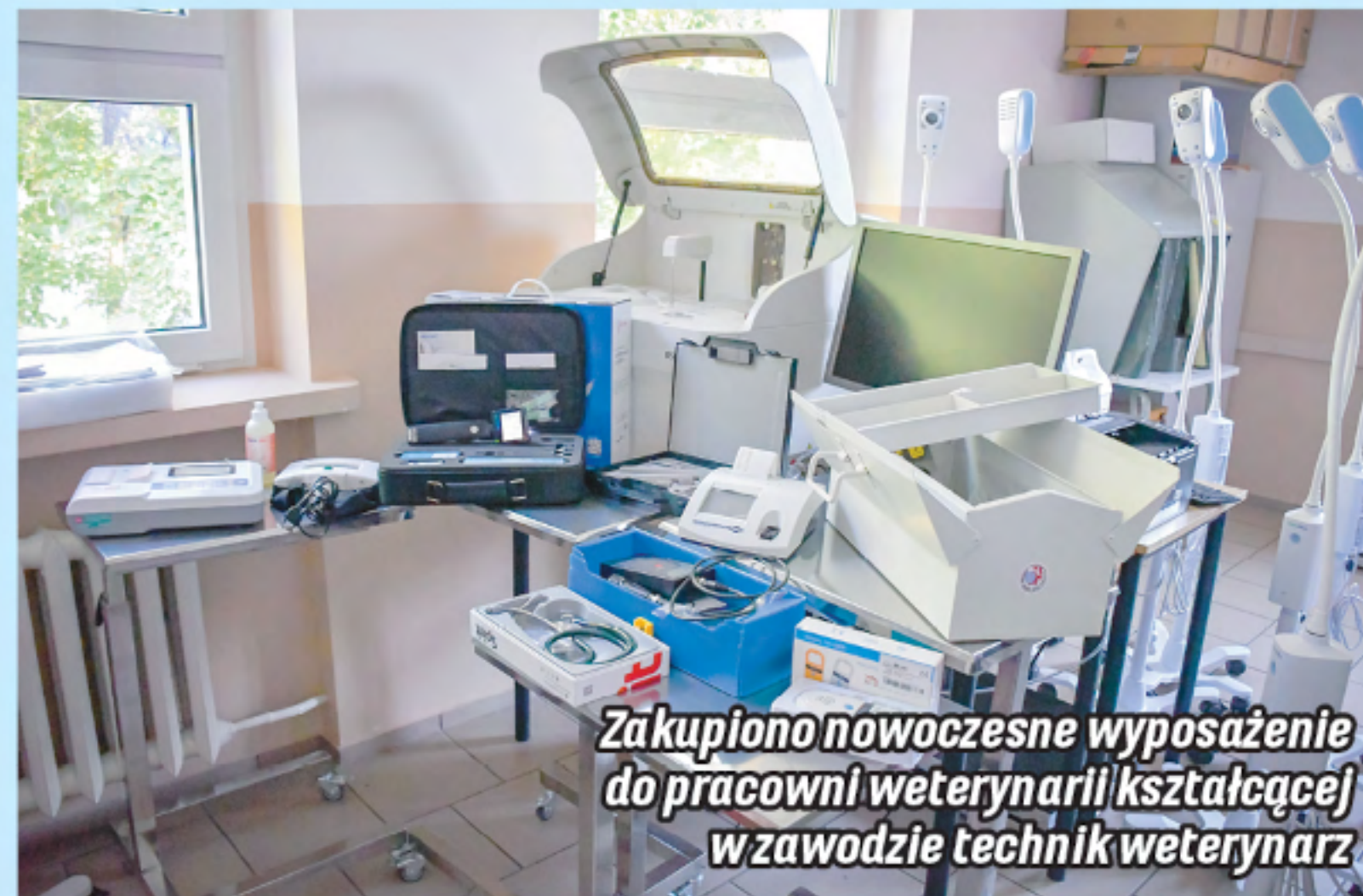
Zakupiono nowoczesne wyposażenie do pracowni weterynarii kształcącej w zawodzie technik weterynarz