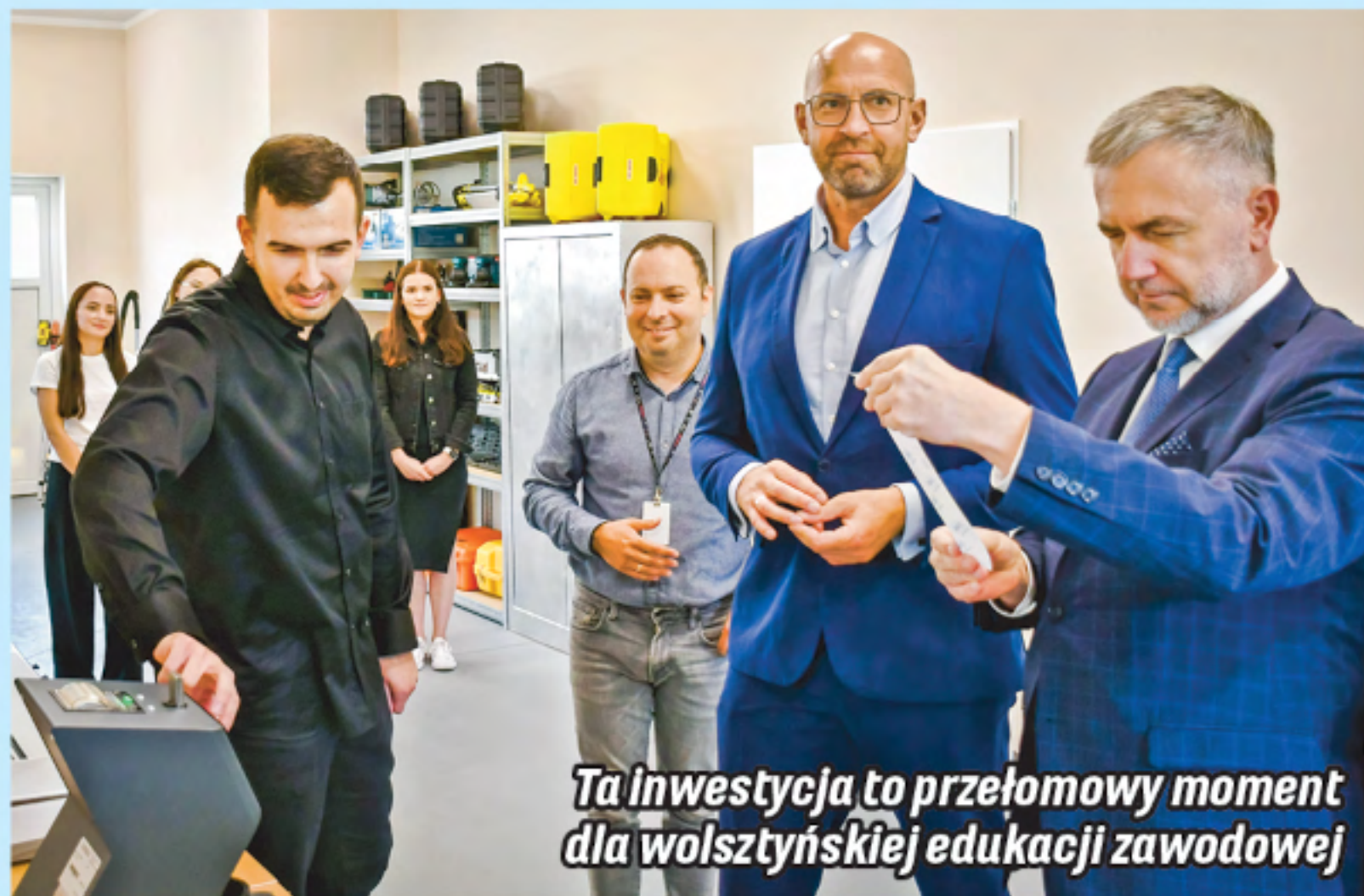
Ta inwestycja to przełomowy moment dla wolsztyńskiej edukacji zawodowej

Podczas rozmów dyrektorzy podkreślili, że absolwenci wolsztyńskich „branżówek” i techników są cenionymi fachowcami na naszym rynku pracy. Wielu przedsiębiorców zaznacza, że dzięki zdobytej wiedzy i praktykom, które uczniowie realizują podczas czasu edukacji, niemal bezproblemowo przechodzą z etapu szkolnego w dorosłość.