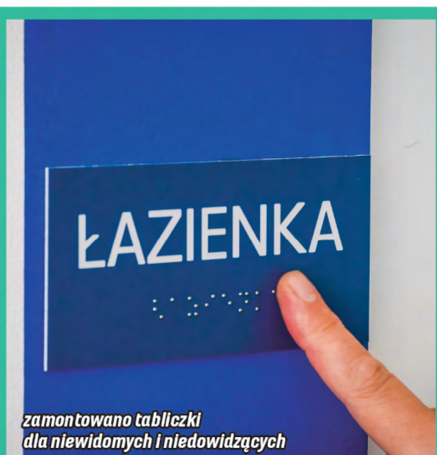
zamontowano tabliczki dla niewidomych i niedowidzących