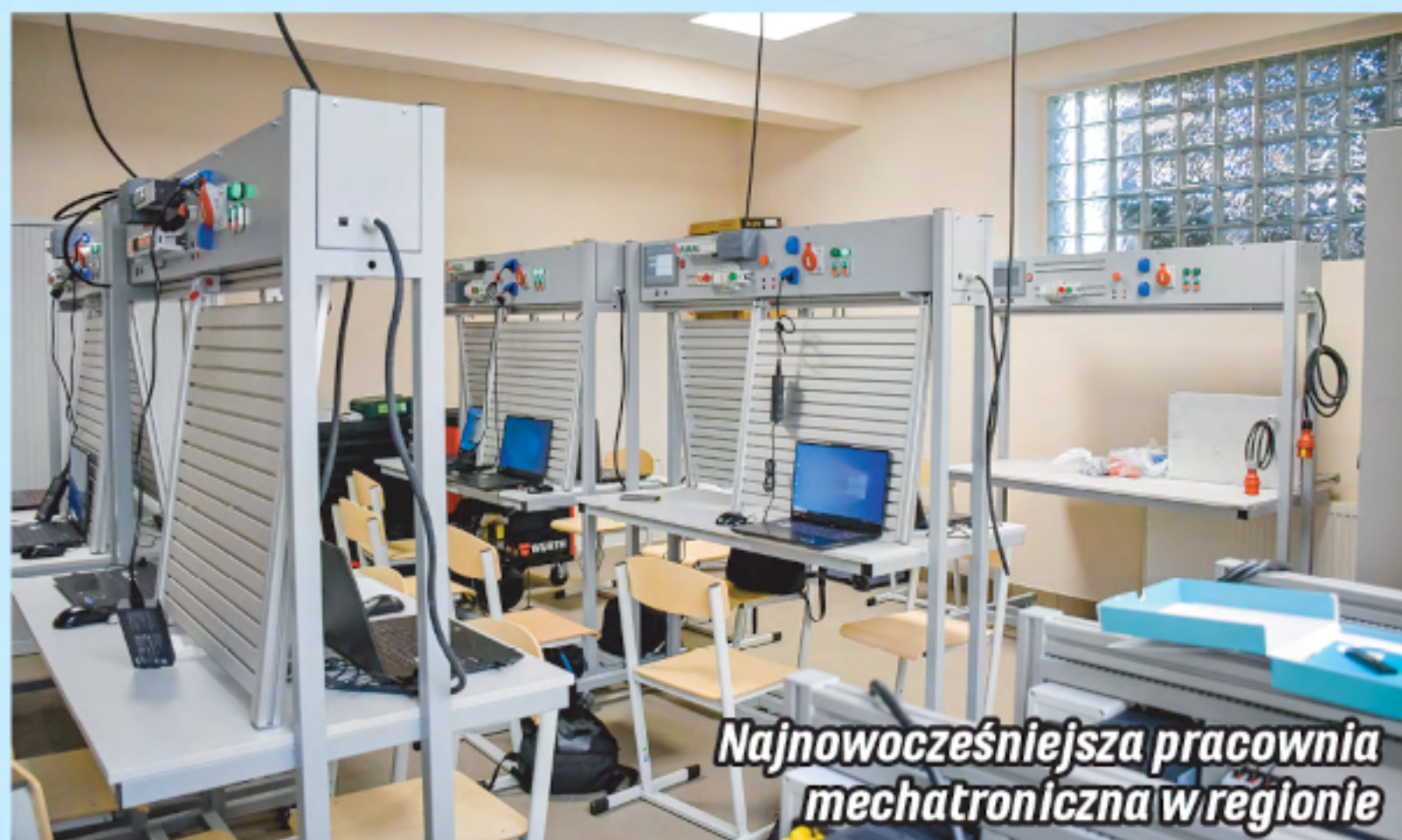
Najnowocześniejsza pracownia mechatroniczna w regionie