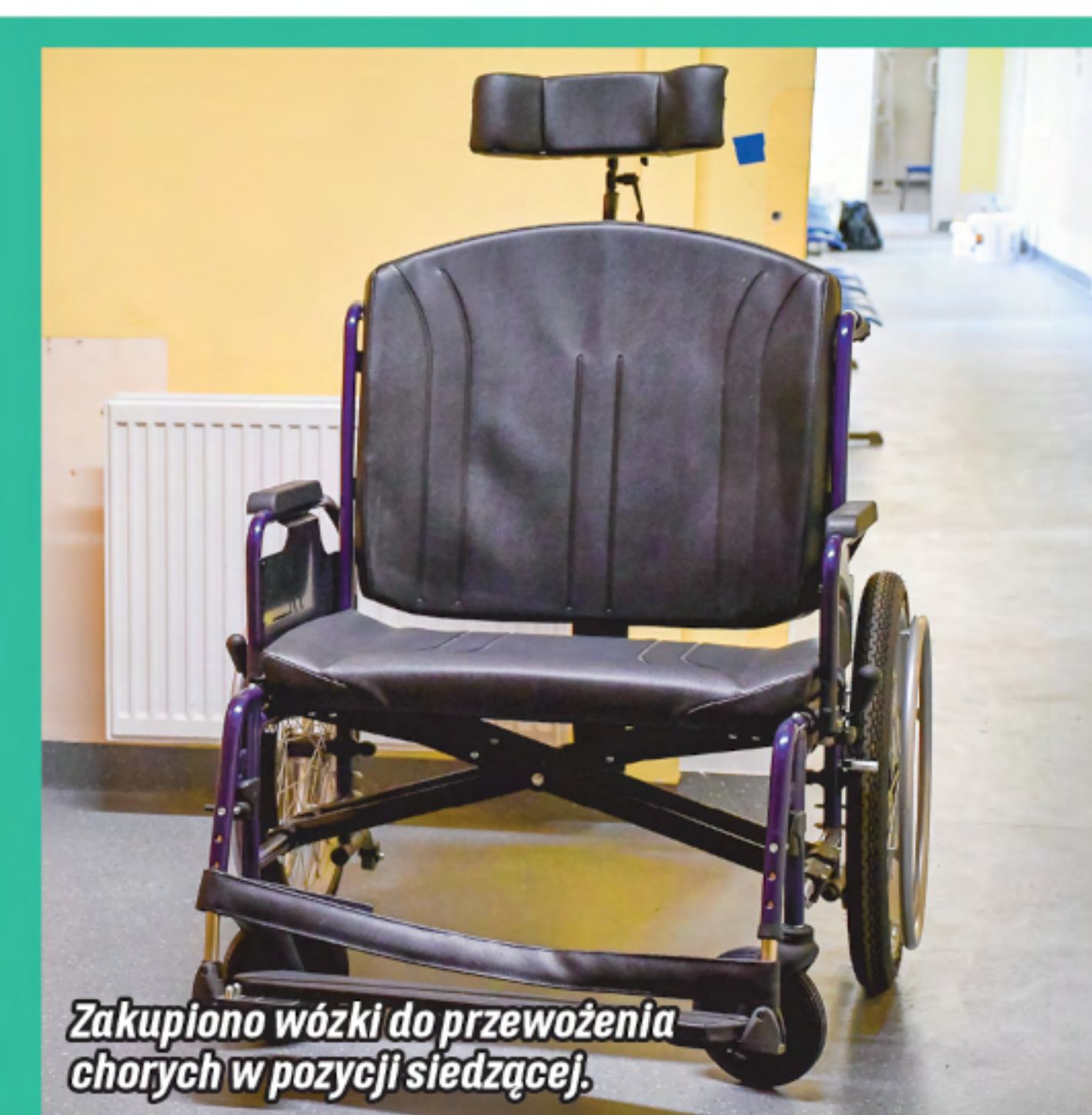
Zakupiono wózek do przewożenia chorych w pozycji siedzącej.