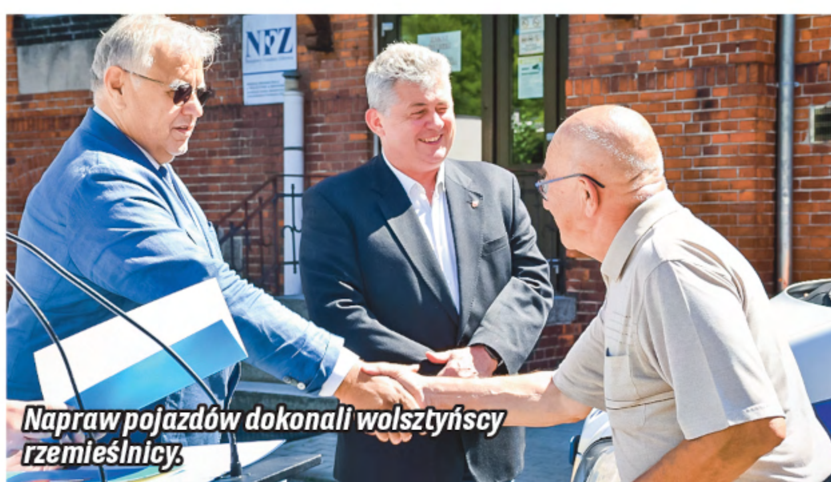
Napraw pojazdów dokonali wolsztyńscy rzemieślnicy.