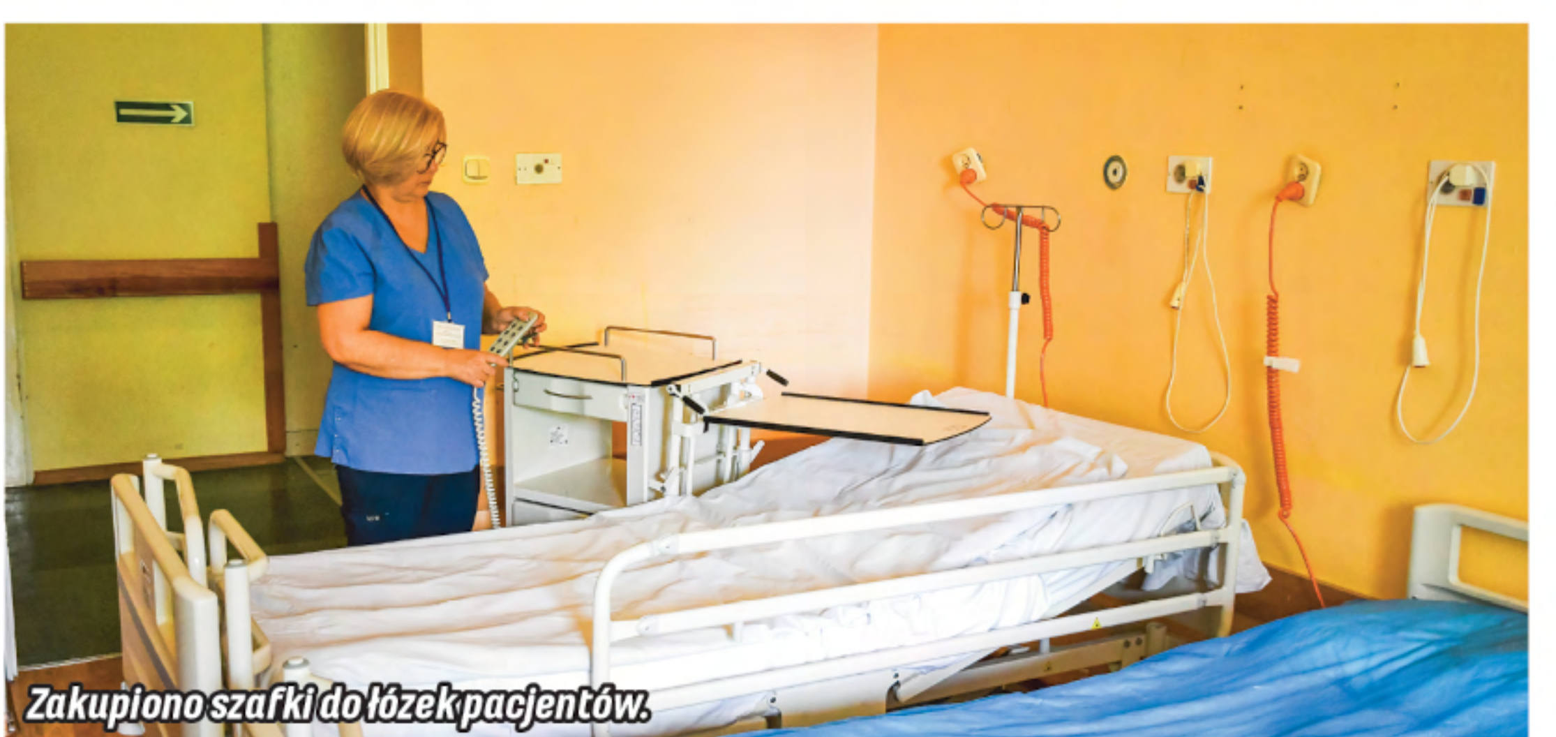
Zakupiono szafki do łóżek pacjentów.