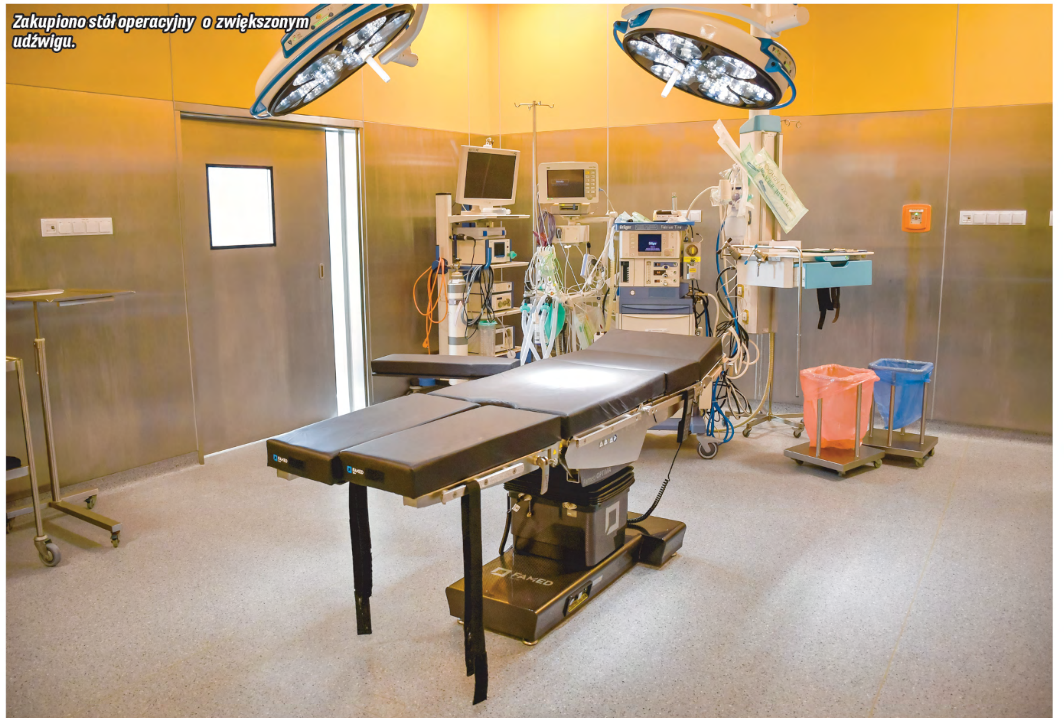
Zakupiono stół operacyjny o zwiększonym udźwigu.

- wielofunkcyjnego, przenośnego podnośnika pacjenta o zwiększonym udźwigu,