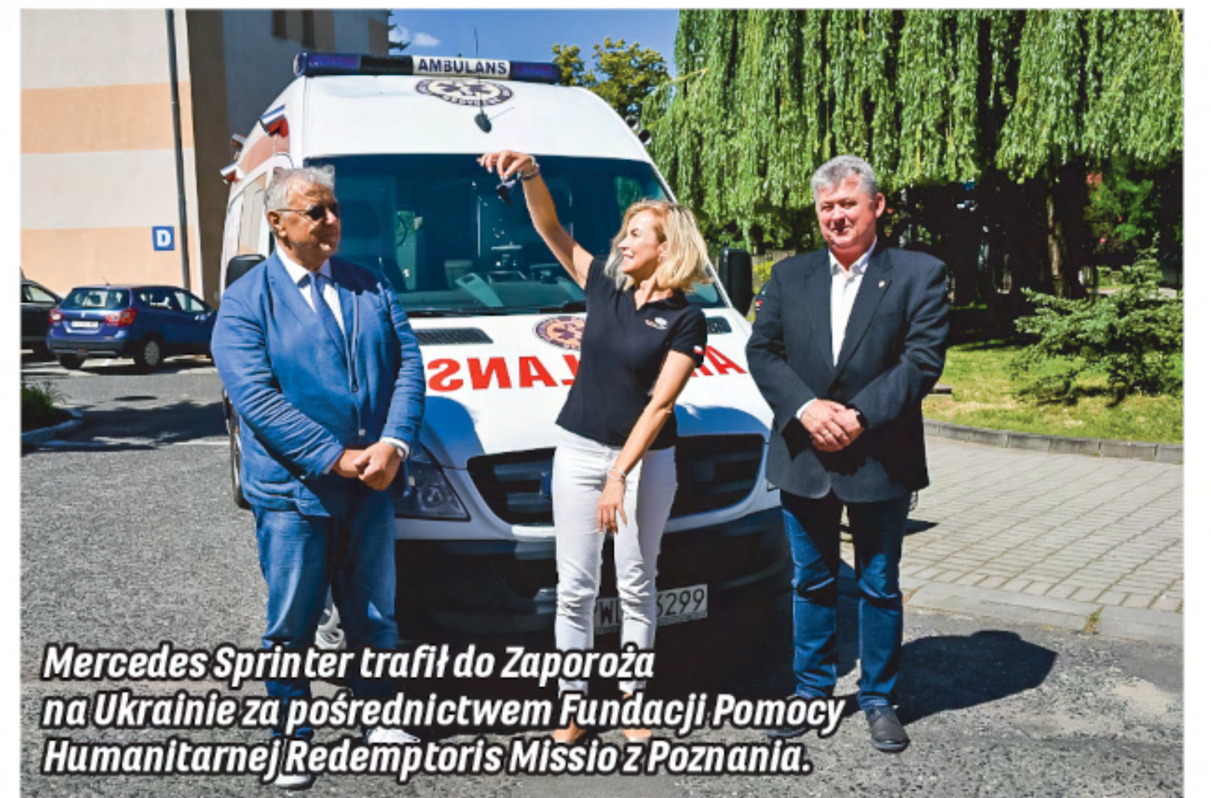
Mercedes Sprinter trafił do Zaporozża na Ukrainie za pośrednictwem Fundacji Pomocy Humanitarnej Redemptoris Missio z Poznania.