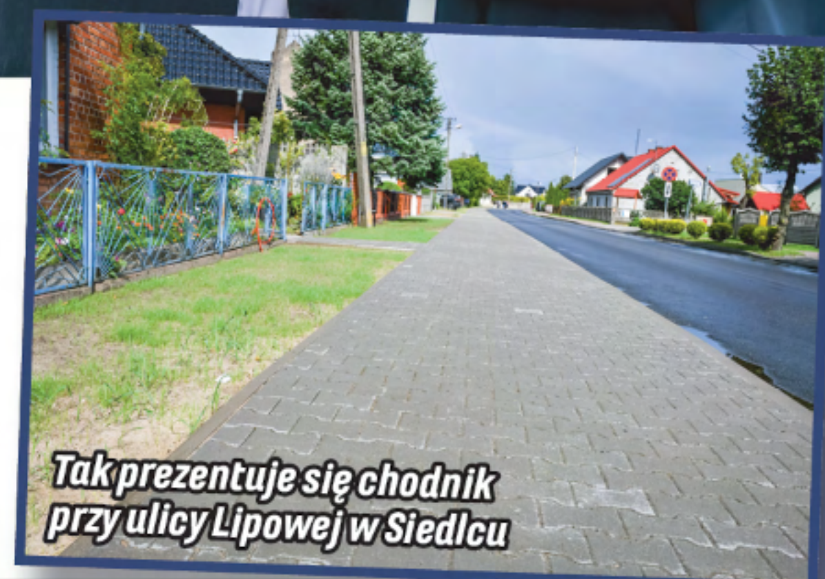
Tak prezentuje się chodnik przy ulicy Lipowej w Siedlcu

że chodnik posłuży mieszkańcom wsi, a przede wszystkim poprawi ich bezpieczeństwo – powiedział starosta.