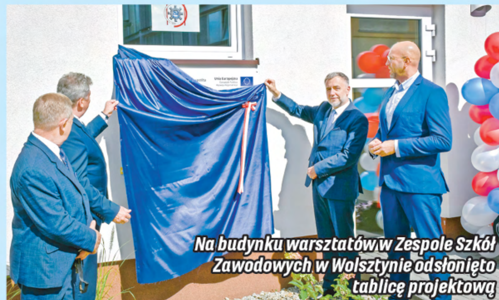
Na budynku warsztatów w Zespole Szkół Zawodowych w Wolsztynie odsłonięto tablicę projektową