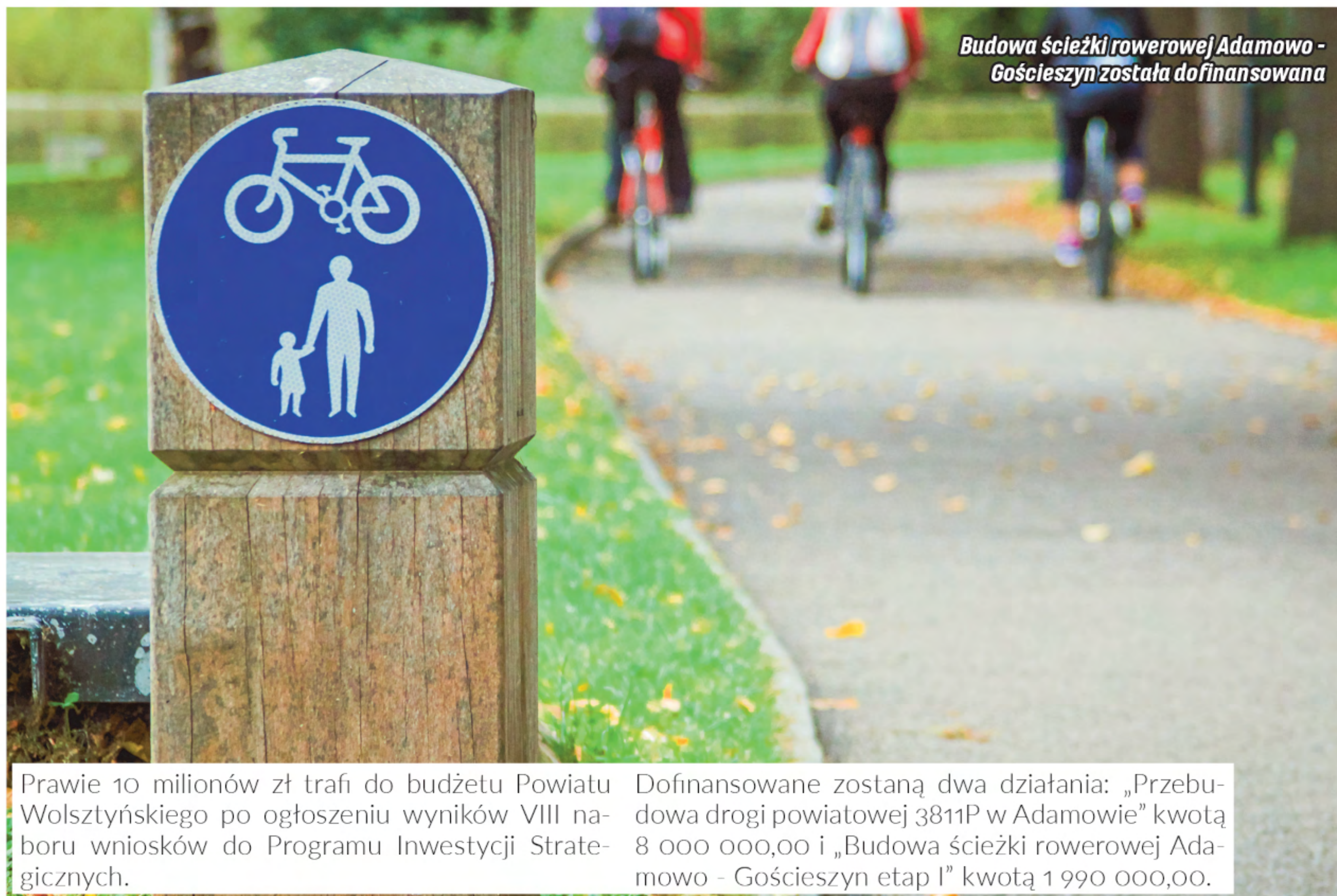
Budowa ścieżki rowerowej Adamowo - Gościeszyn została dofinansowana

Prawie 10 milionów zł trafi do budżetu Powiatu Wolsztyńskiego po ogłoszeniu wyników VIII naboru wniosków do Programu Inwestycji Strategicznych.